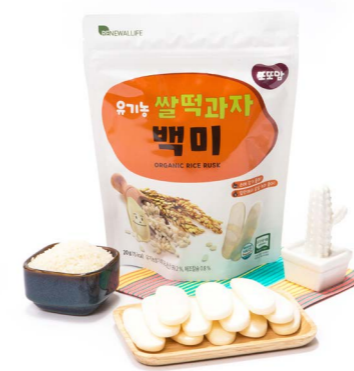
유기농 쌀떡과자 백미 (20g x 20ea)

기름에 튀기기 않고 열과 압력만으로 퍼핑하여 입에서 잘녹고 부드러운 식감으로 만들었습니다.