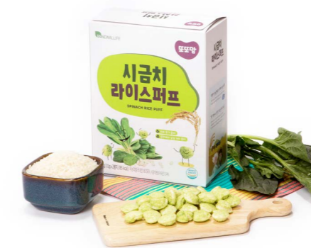
시금치 라이스퍼프 (20g x 20ea)