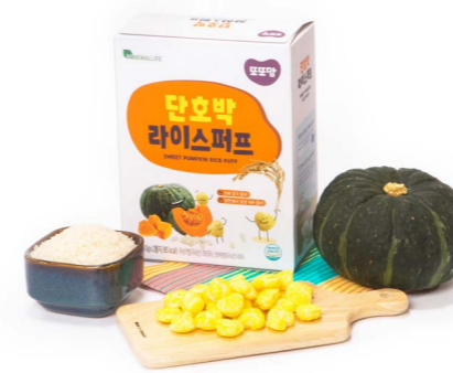
단호박 라이스퍼프 (20g x 20ea)