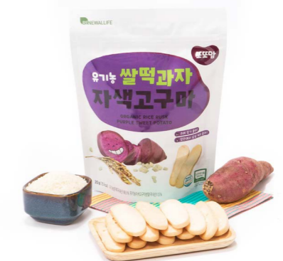
유기농 쌀떡과자 자색고구마 (20g x 20ea)