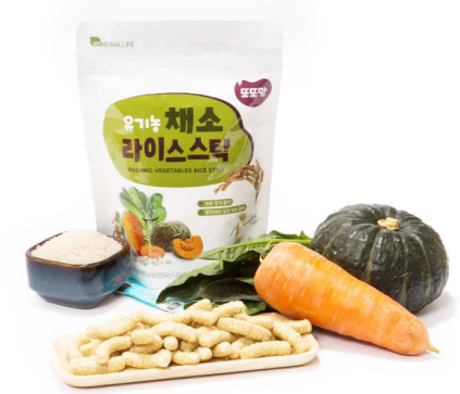
유기농 채소 라이스스틱 (20g x 20ea)