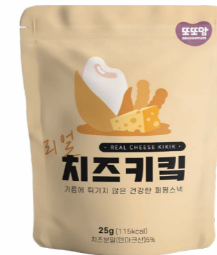
리얼 치즈키킥 (25g x 20ea)