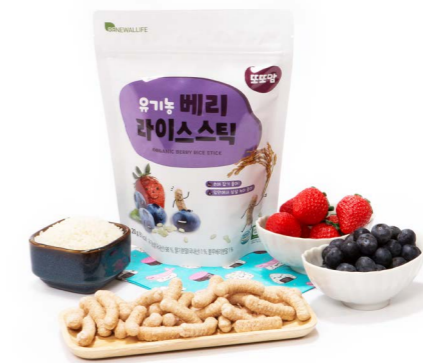
유기농 베리 라이스스틱 (20g x 20ea)