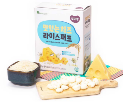
맛있는 치즈 라이스퍼프 (20g x 20ea)