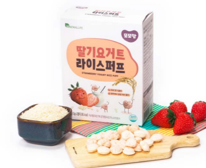
말기요거트 라이스퍼프 (20g x 20ea)