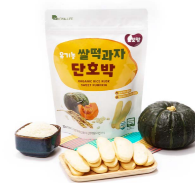
유기농 쌀떡과자 단호박 (20g x 20ea)