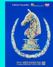
■ 2018 대한민국 친환경 유기농 브랜드 대상수상