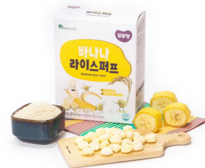
바나나 라이스퍼프 (20g x 20ea)