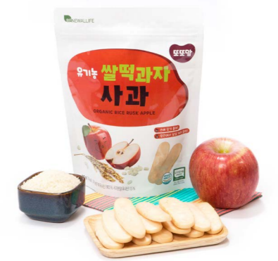
유기농 쌀떡과자 사과 (20g x 20ea)