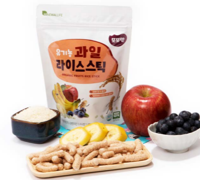
유기농 과일 라이스스틱 (20g x 20ea)

제조 시설을 믿을 수 있는 또또맘! 모든 것이 소중한 우리 아이가 먹는 믿을 수 있는 쌀과자를 ISO국제인증을 받은 생산 시설에서 생산합니다.