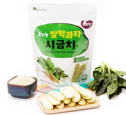
유기농 쌀떡과자 시금치 (20g x 20ea)